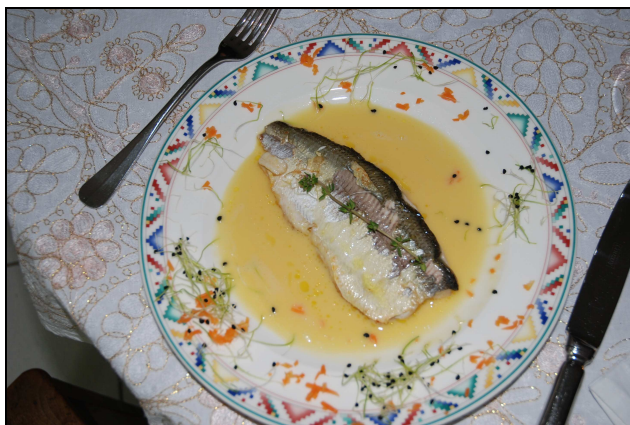
Le filet de Fera à l'infusion d'échalotes avec sa caresse de caramel

Calamin « Vertige » 2007 Raymond Chappuis, Chardonne